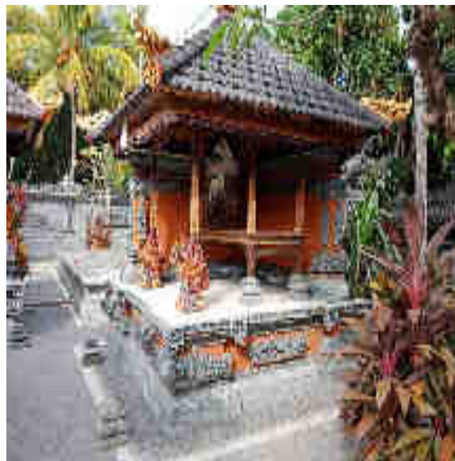
° b el° pê s n/.