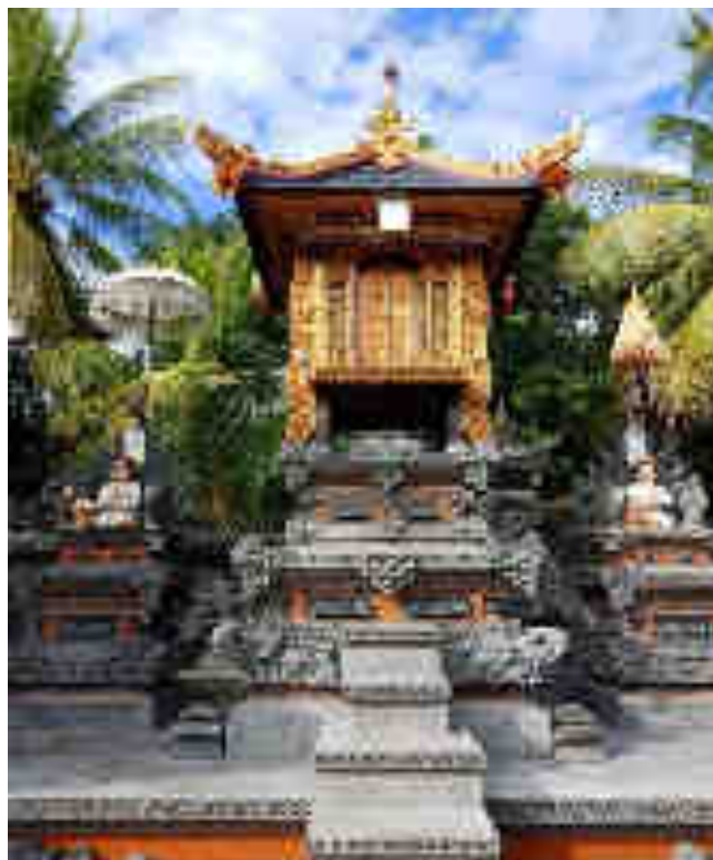
Palinggih Ratu Gedé Serabad