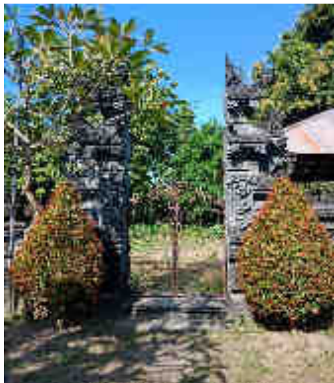
° c xØ° p m) d l°Đ wu;.