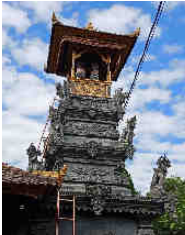
Balé Kulkul Palingih Ratu Gedé Suara