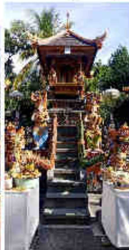
ស្ថាបតិក

វិថីស្ថាបតិកស្ថិតនៅក្នុងប្រាសាទបាវ្យាណៈ ភ្នំពេញ