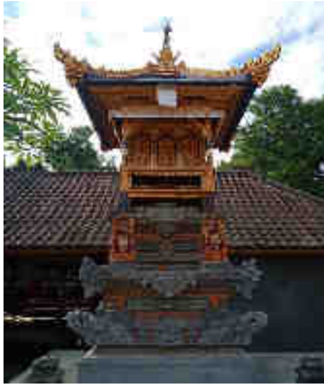
Kamulan Palinggih SangHyang Tiga Sakti