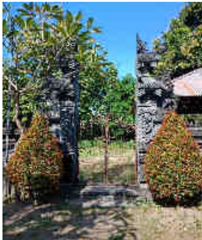
Candi Pamedal Kauh