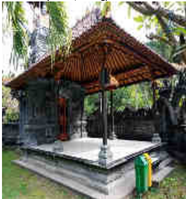
° b el° eG*ÿ° h lØ t/. °