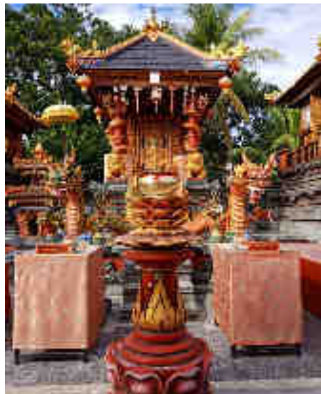
Palinggih Ratu Bagus Mas Subandar