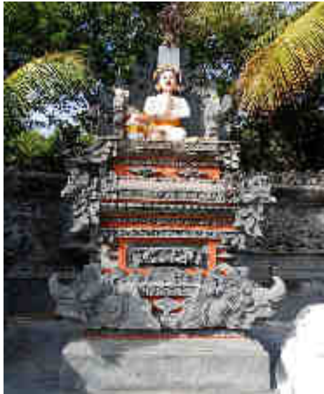
Palingih Ancangan Ida Bhatara