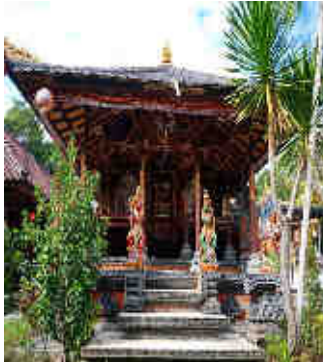
Balé Pamaruman Palinggih Ida Bhatara Turun Kabéh