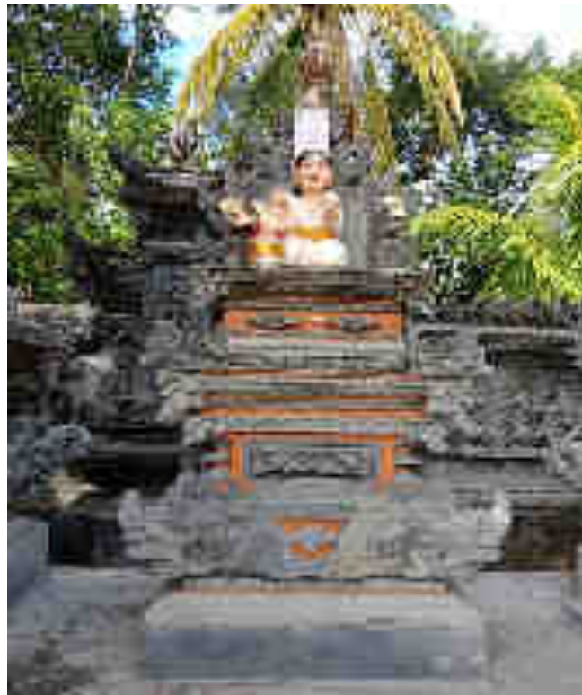
Palinggih Ancangan Ida Bhatara