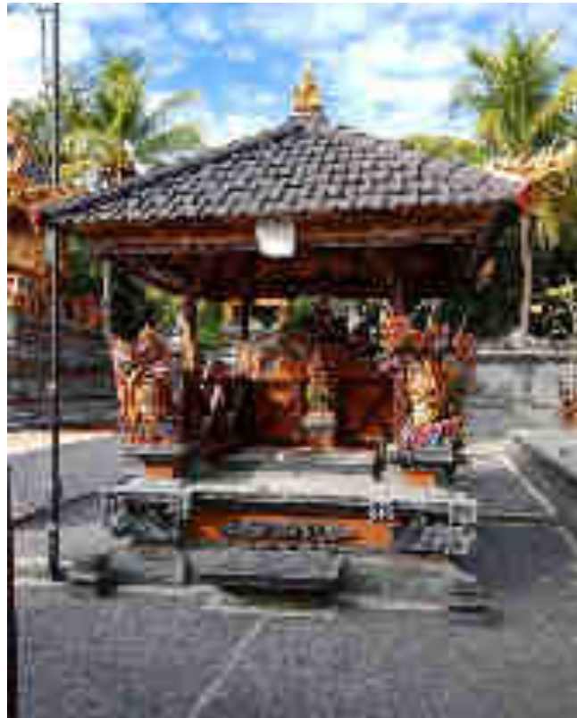
° su mu(° ´u ci.