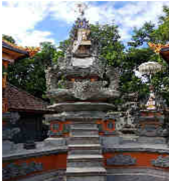
Padmasana Palinggih Sang Hyang Luhuring Akasa