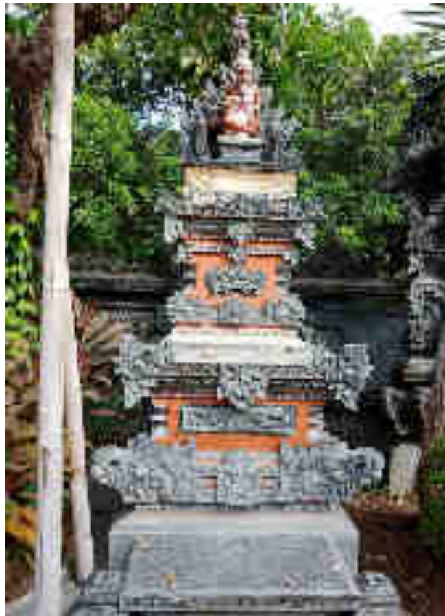
Palinggih Ratu Gedé Panyarikan