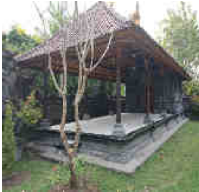
Balé Gong Gedé miwah Gedong Simpen