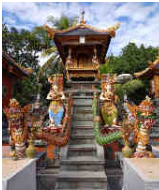
Palinggih Ratu Ayu Jong Galuh