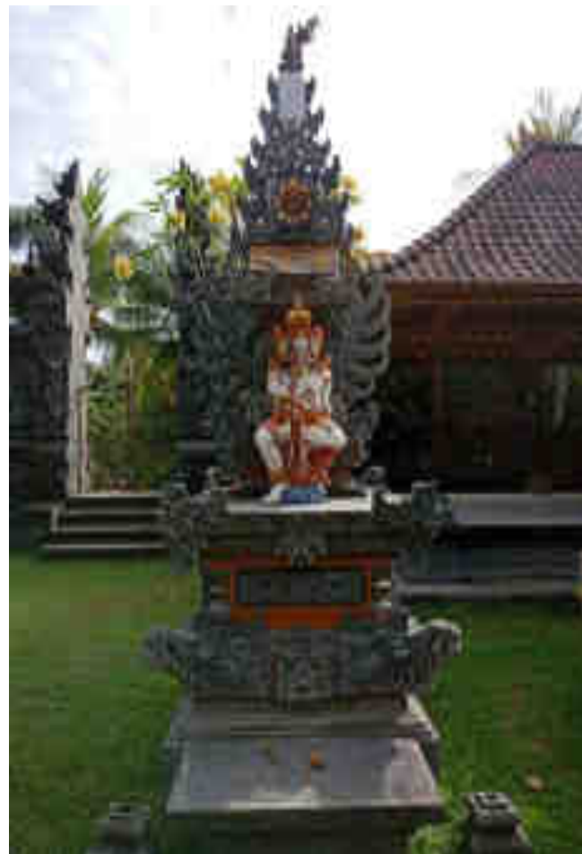
Palinggih Ratu Gedé Segara