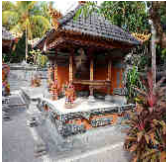
Balé Piasan Palinggih Ngias Ida Bhatara-bhatari