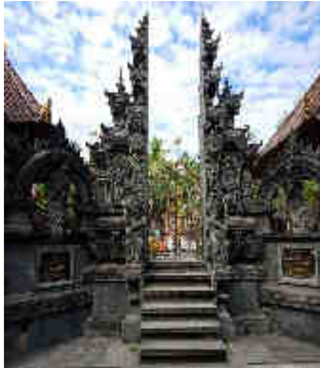
Candi Bentar utawi Pamedal Agung