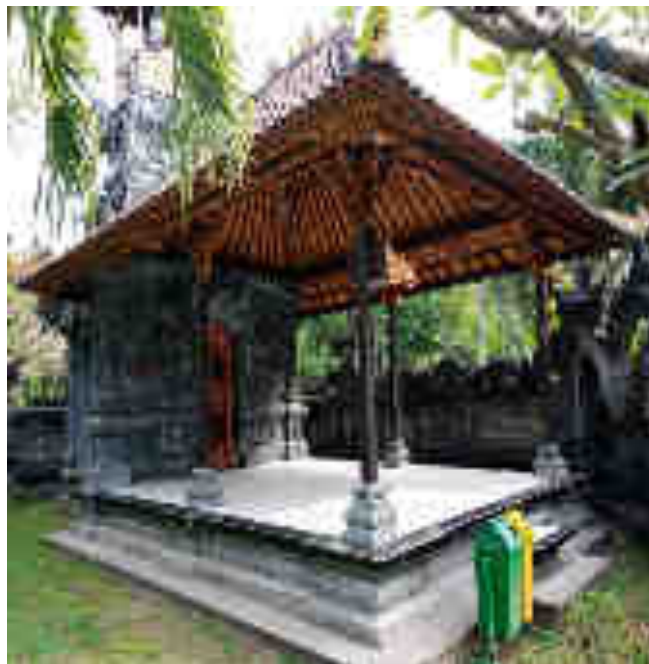
Balé Gong Alit