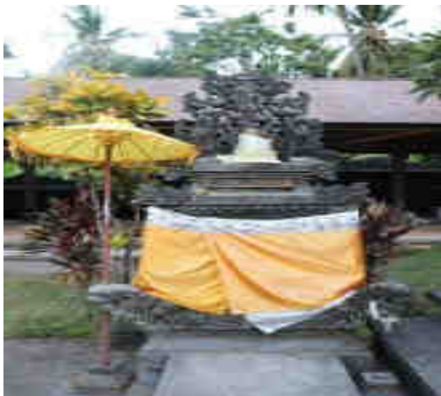
Palinggih Ratu Gedé Penyarikan