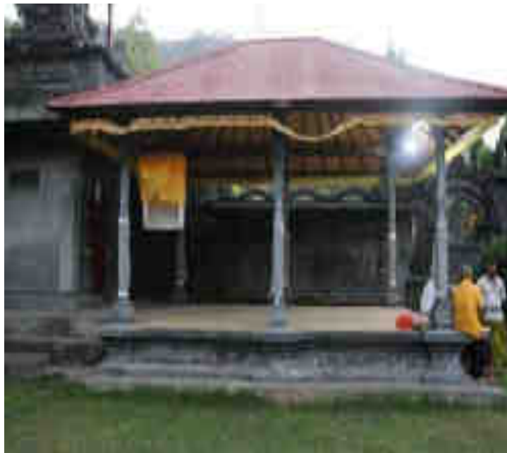
ព្រះបារមី