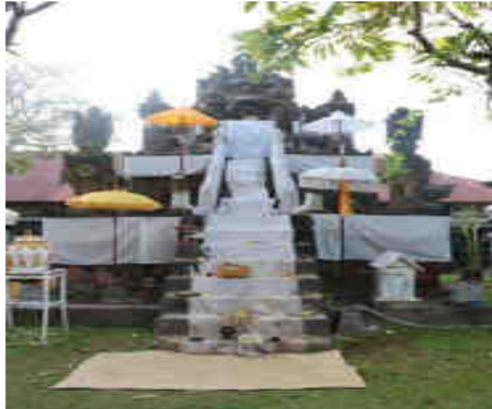
Padma Palingih Ratu Ayu Mas Dalem utawi Ratu Ayu Laksmi