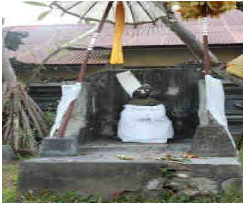
ຕາຕາເງກສີ ບໍລິເວນຕູ້ຖືກສົມທາລາກຸ່ມ