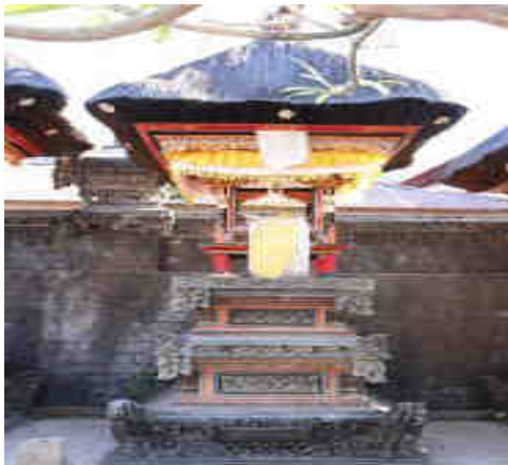
Palinggih Gedong Bétél Palinggih Déwa Nawasanga