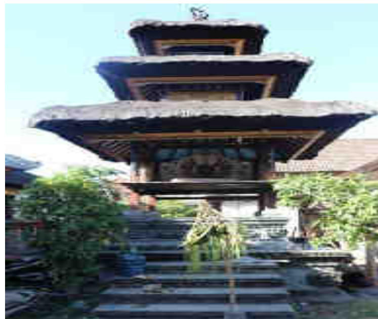
Palingih Ratu Gedé Tangluk