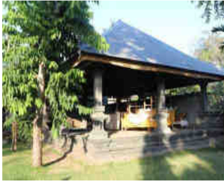
ព្រះបរមរាជវាំង