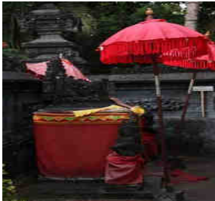
Palingih Ratu Pandé