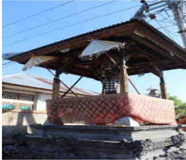
Balé Kulkul Kumis