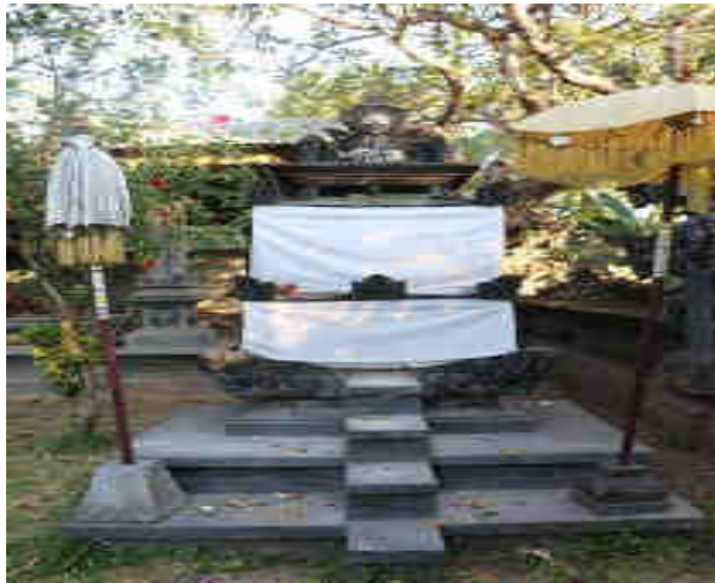
Bebaturan/Sanggaran Linggih Ida Ratu Gedé Pakenca