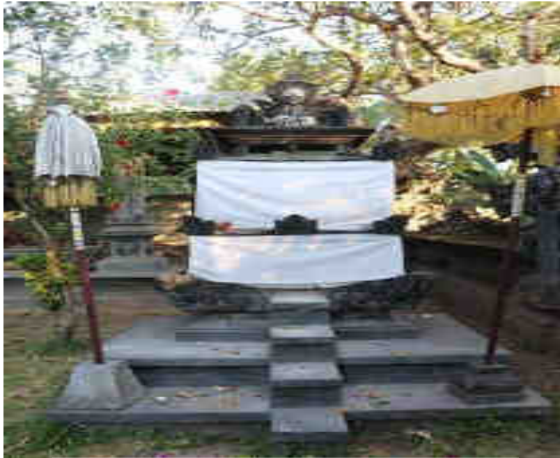
ဓာတ်တော်ကွေ့ကွေ့ ပုထိုးကွေ့ကွေ့ပုထိုးပုထိုး