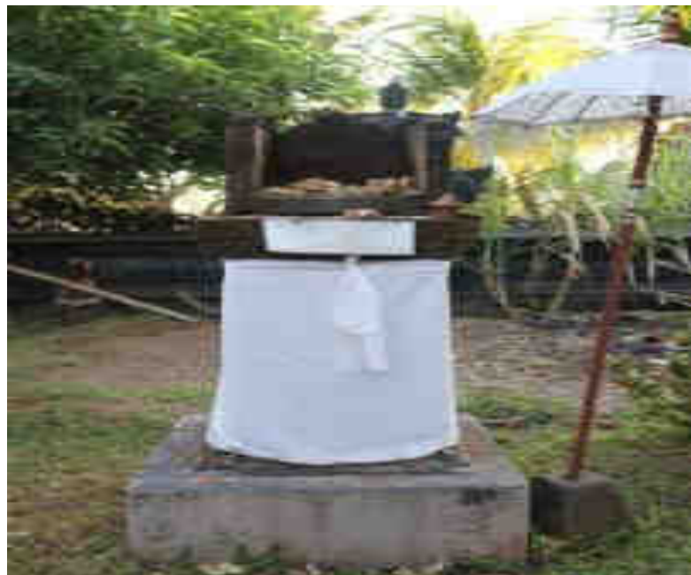
Padma Sari Palinggih Ratu Gede Dalem Segara