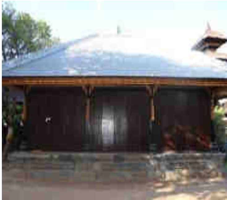
ពារពលបតិរាមនីត្តវត្តភ្នំព័រ្យា