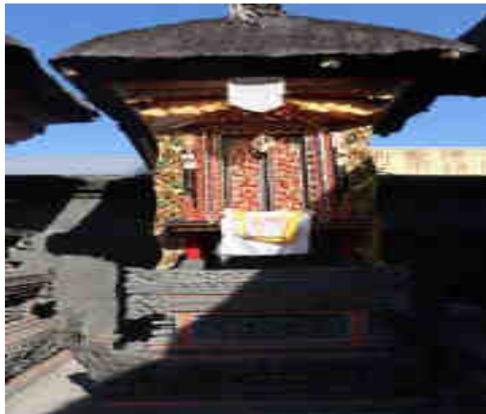
Palinggih Pura Utus