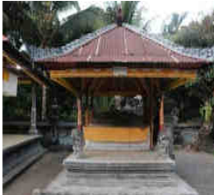
Piasan Palinggih Sang Hyang Wenang