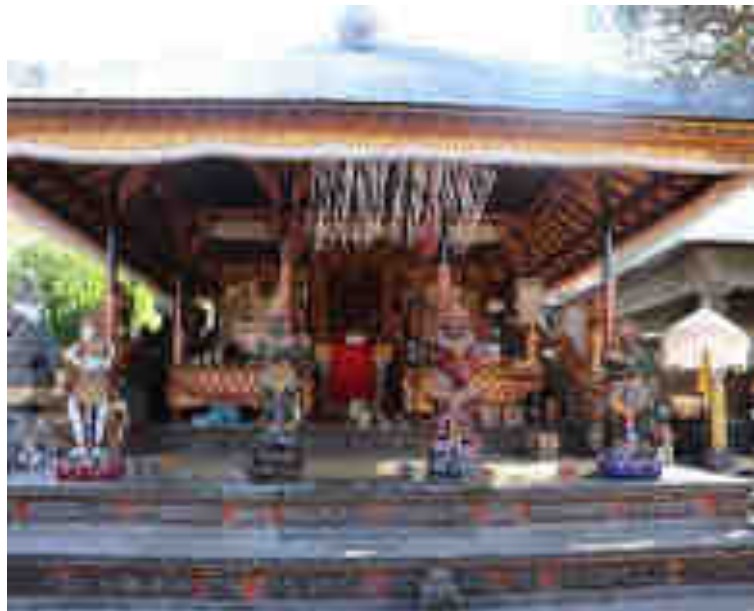
ຫ້ອງພາຍໃນຮູບພາບທາງເໜືອ