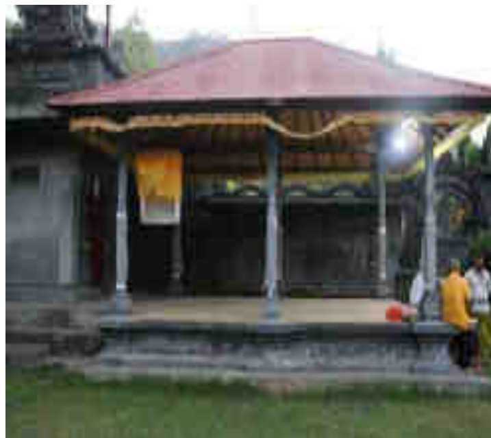
Balé Gong Alit