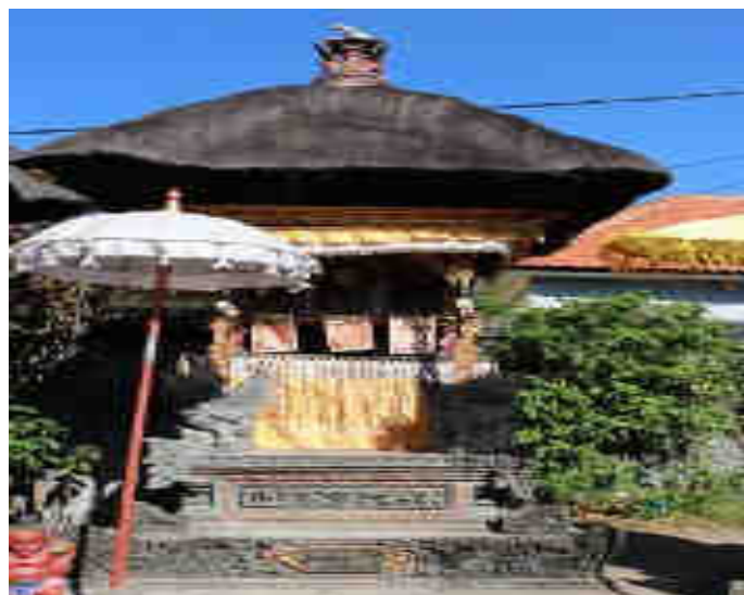
Tiga Sakti Kamulan

Palinggih Déwa Brahma, Déwa Iswara, miwah Déwa Wisnu