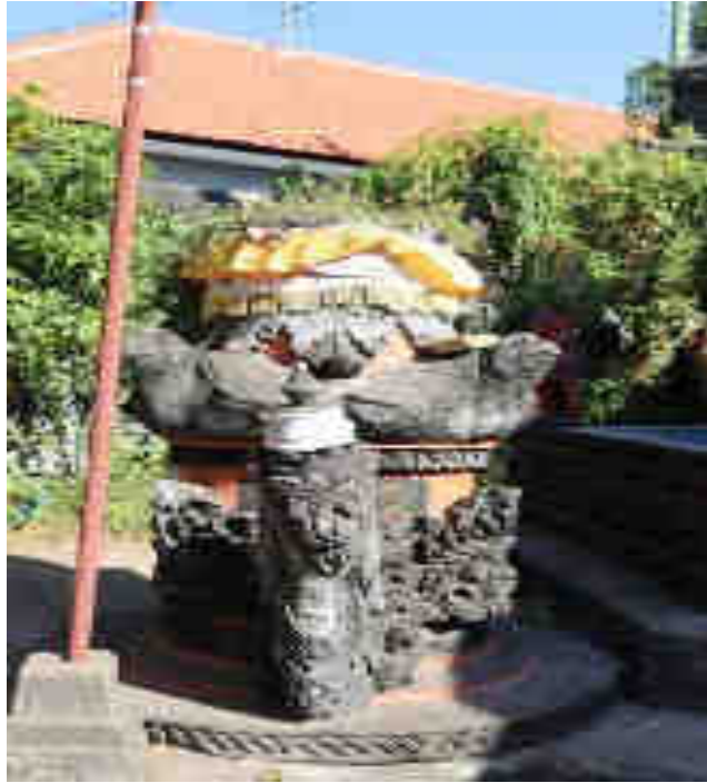
Palinggih Basukihan Palinggih Ida Bhatara Naga Basukih