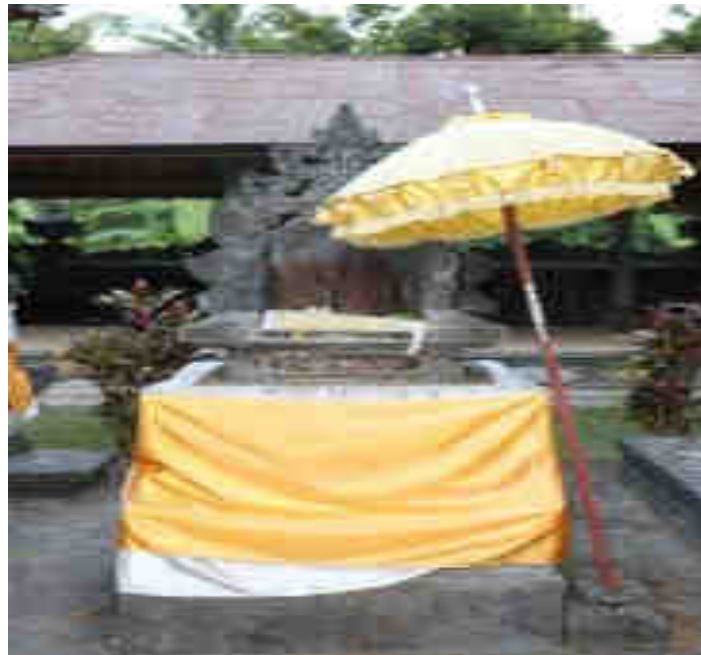
Patakson Palinggih Ratu Ngurah Tangkeb Langit