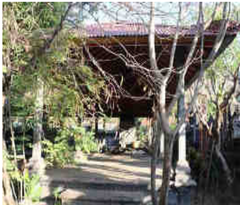
បរមរាជវាំង