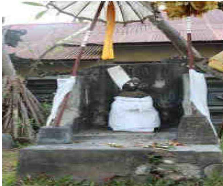
Bebaturan Palinggih Ida Sedahan Pangénter