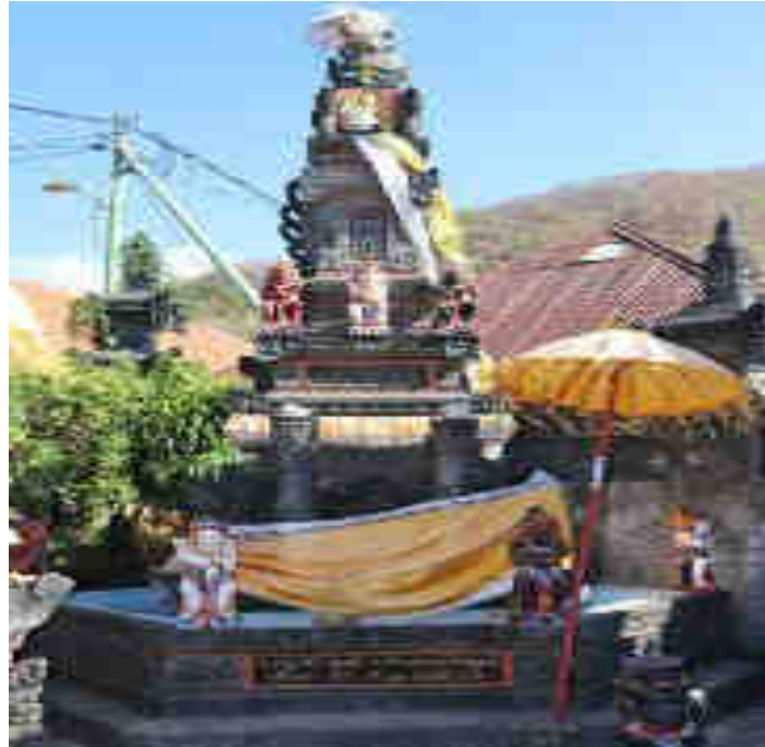
ບາບ ບາບຮູ້ຮູ້ສາມຮູ້ບາບຮູ້ຮູ້ສາມຮູ້