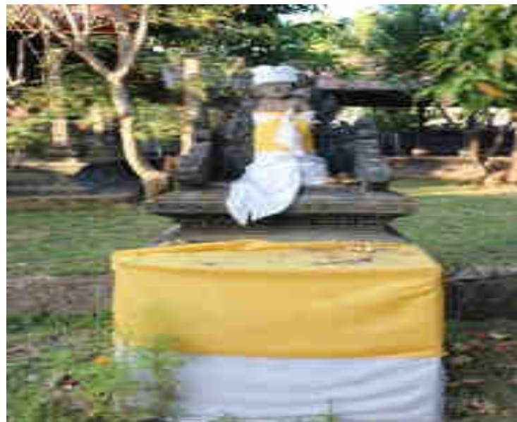
Bebaturan Palinggih Ratu Nyoman Sakti Pangadangan