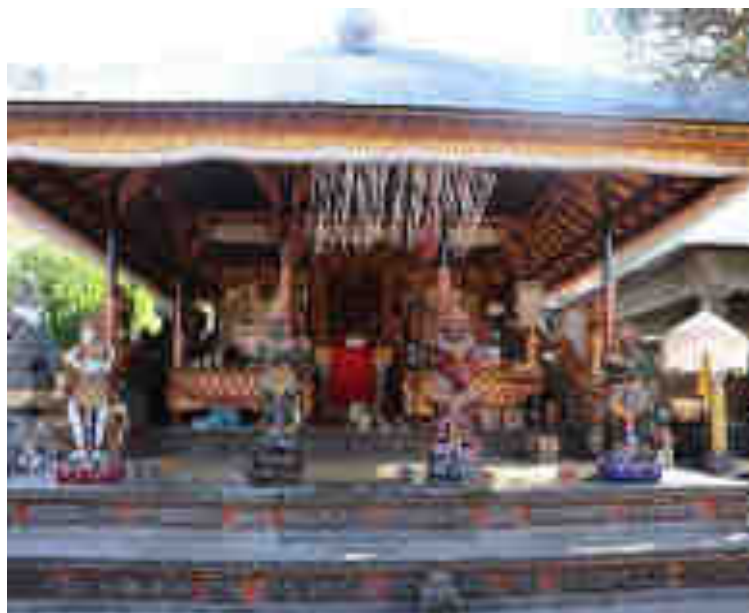
Gedong Palinggih Ida Bhatara Brahma