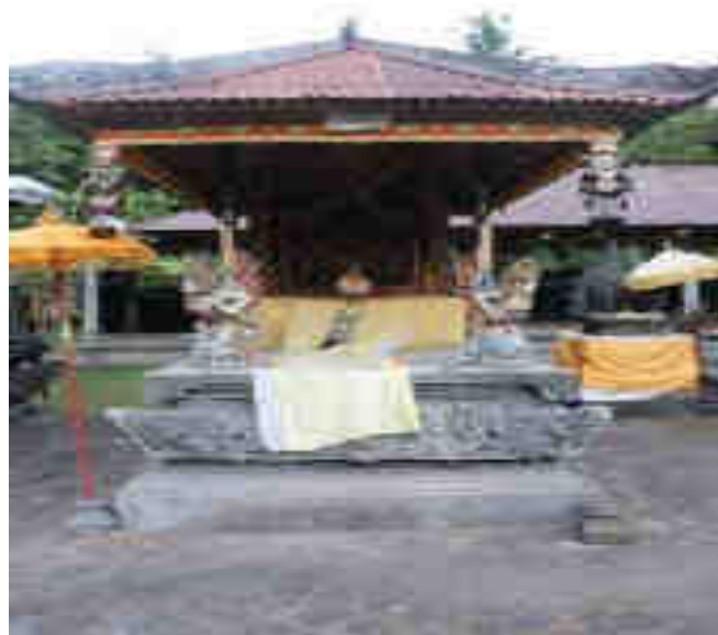
Manjangan Saluang Palinggih Ida Bhatara Mpu Kuturan