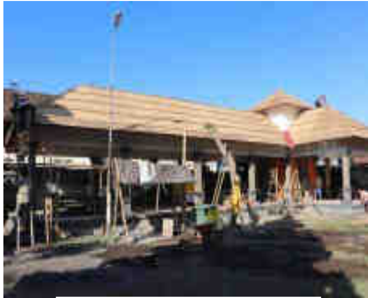
ຕາງນປຍາລາລາ