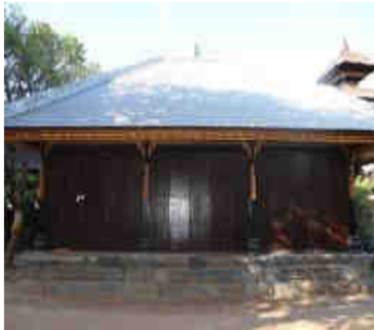
Panyimpenan Gong Gedé