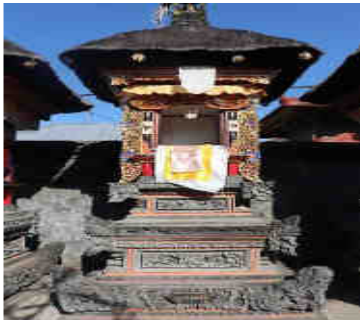
Palinggih Pura Ulun Danu Batur