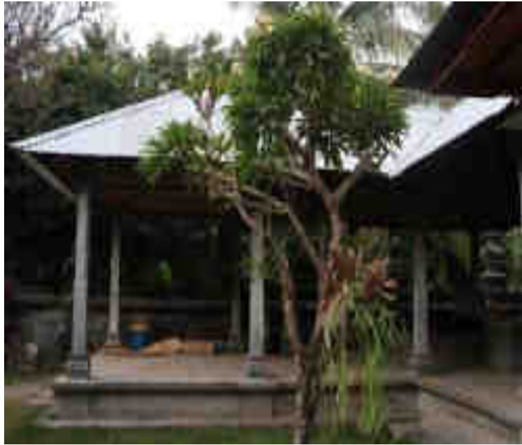
ပကရွဲစာရီ။