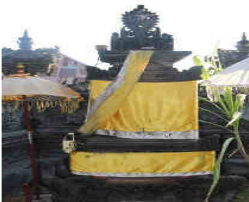
Padma Palingih Sang Hyang Prajapati