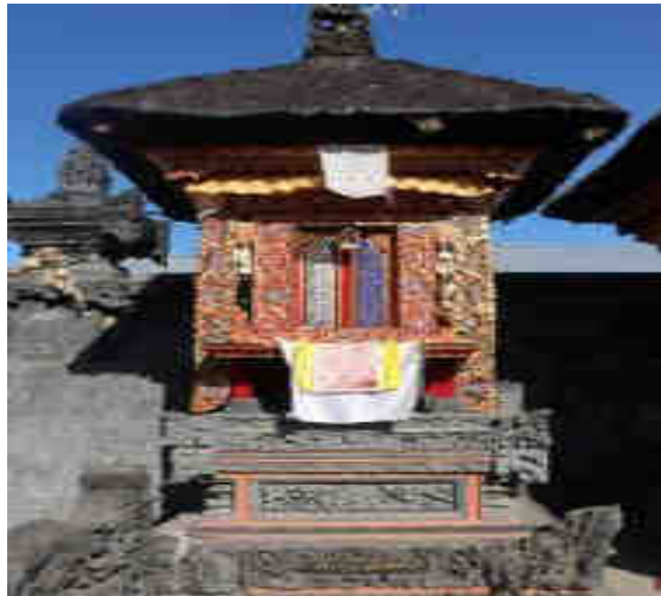
Palinggih Ratu Pasek