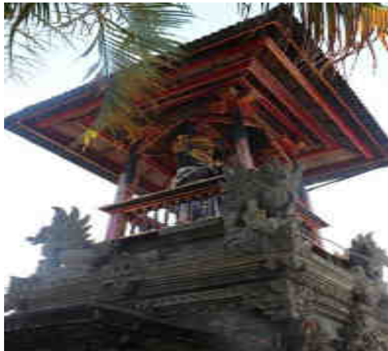
បារាយណ៍ភ្នំ