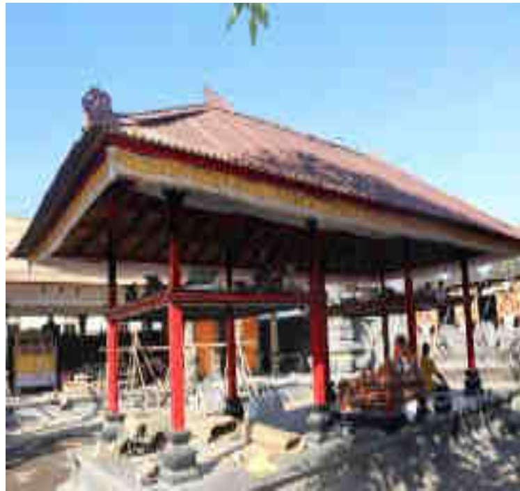
Asagan utawi Panggungan