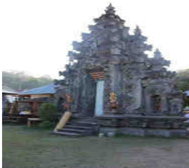
Candi Gelung utawi Bentar (Padu Raksa)