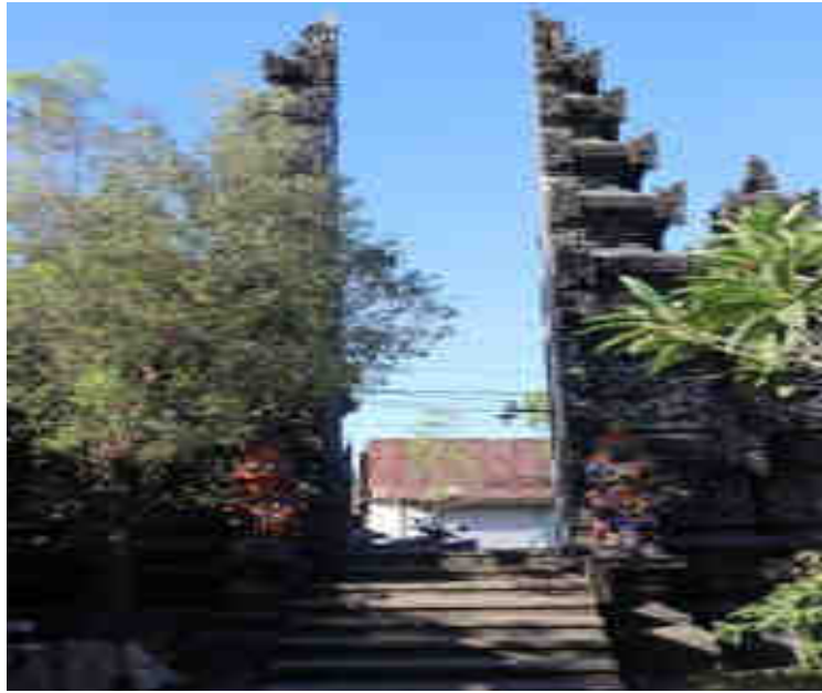
សន្តិភ័ក្ត្រ។