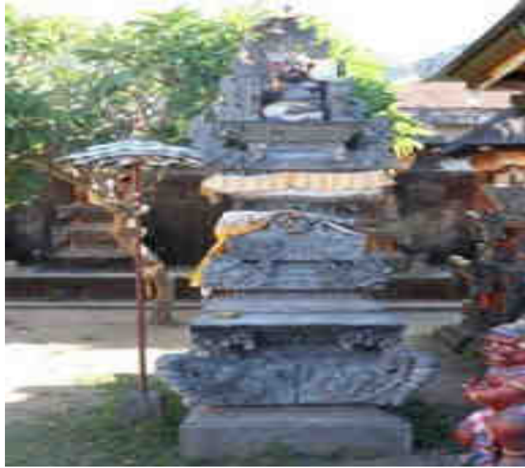
ບໍລິເວນກາງທາງທາງເໜືອ