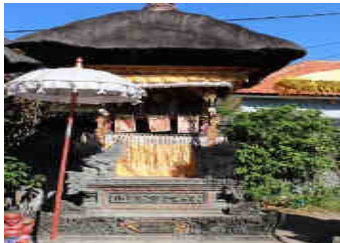
ບາບສາມຮູ້ສາມຮູ້ ບາບຮູ້ຮູ້ສາມຮູ້ບາບຮູ້ຮູ້ສາມຮູ້