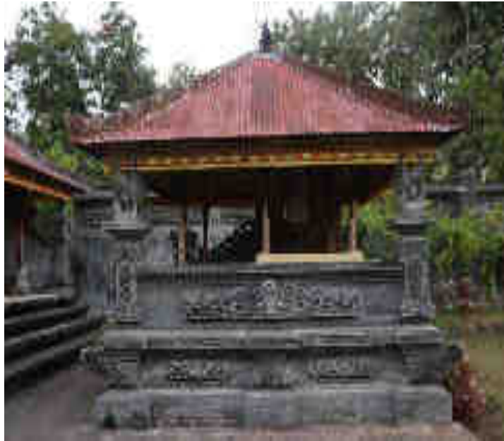
ບາງຍາສູນນິທິທາດຊີ້