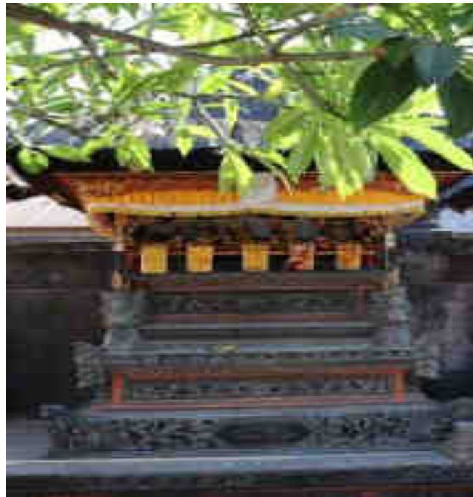
Lepitan utawi Pesarén Sari Rong Lima Palinggih Panca Déwata