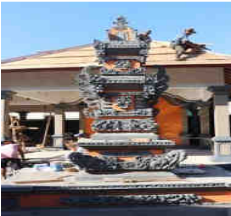
ບໍລິເວນກາງຕົ້ນທາງ