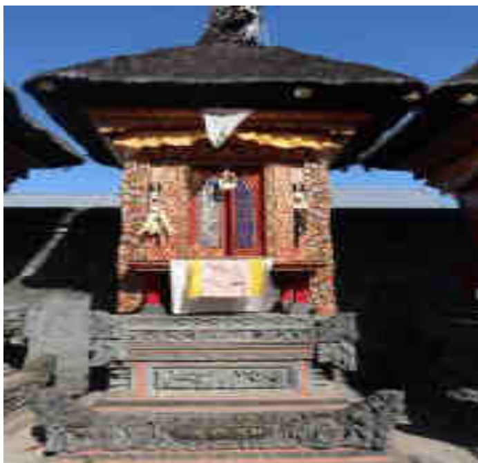
Palinggih Ratu Bendésa