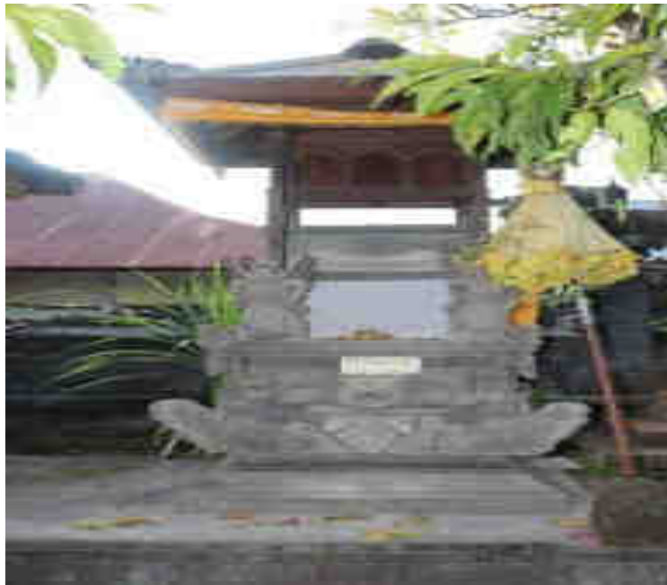
Rong Tiga Palinggih Sang Hyang Tiga Sakti Kamulan