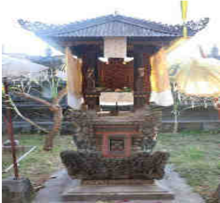
ປຽມລຽກບໍ່ທິ