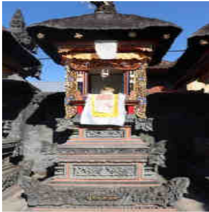
Palinggih Pura Désa Sukawana