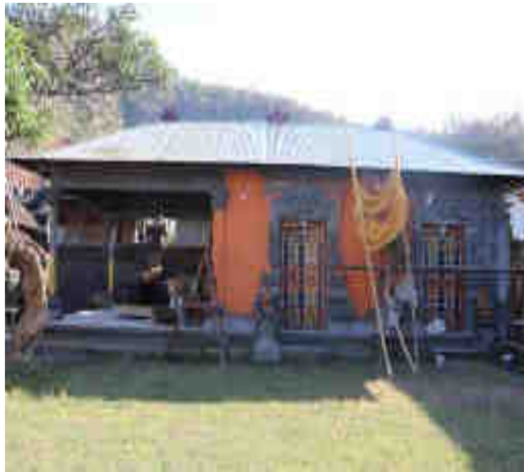
Panyimpenan Gong Ageng lan Gong Alit