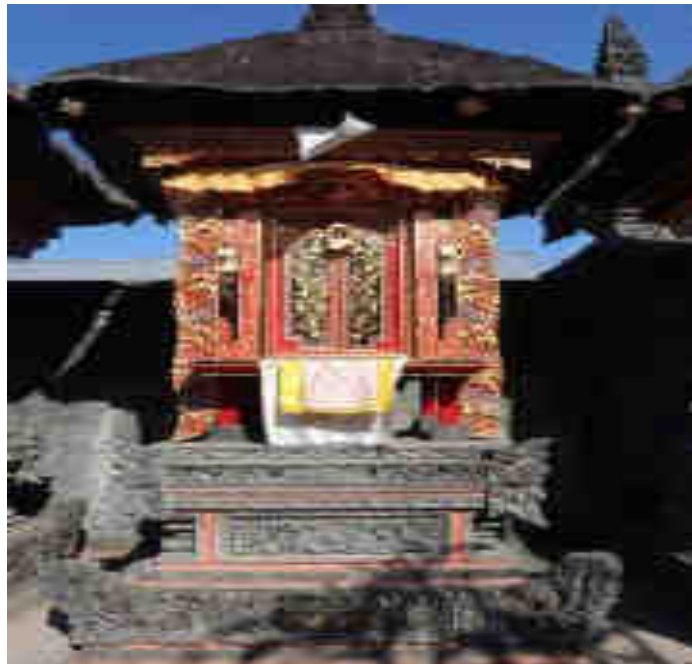
Palinggih Ratu Pandé