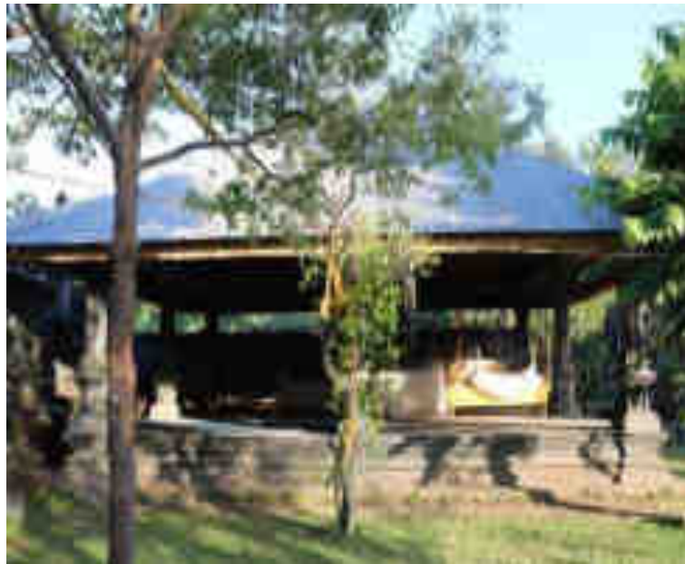
Bale Gong Gedé