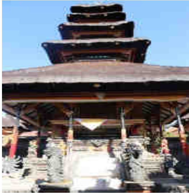
Palinggih Méru Tumpang Lima Linggih Ida Bhatara Wisnu