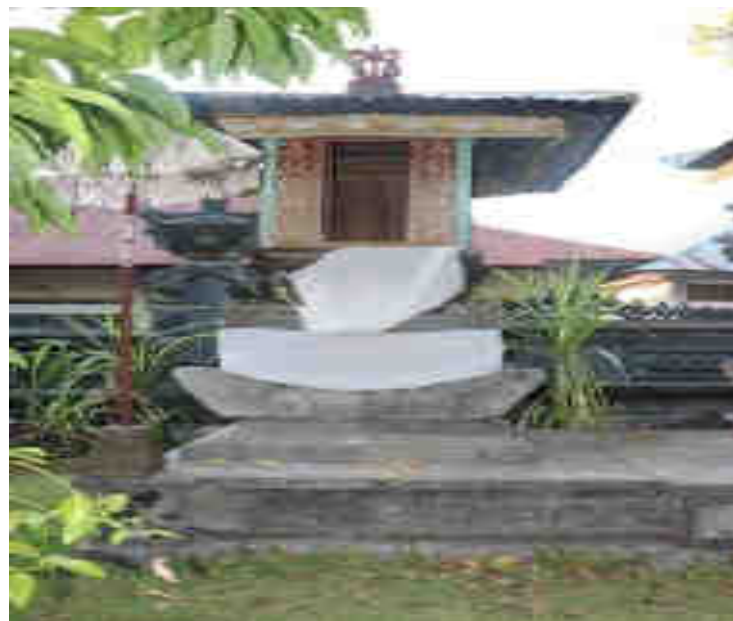
Gedong Palingih Ratu Gedé Mutering Jagat