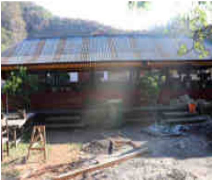
ពារពលពន្លឺ