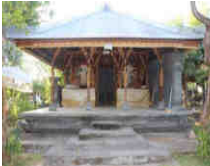
Paruman Gunung Rata Pasamuan Ida Bhatara Sami