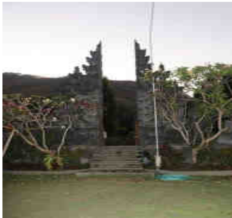
ဆဋ္ဌိဗိက္ခိဏီ။