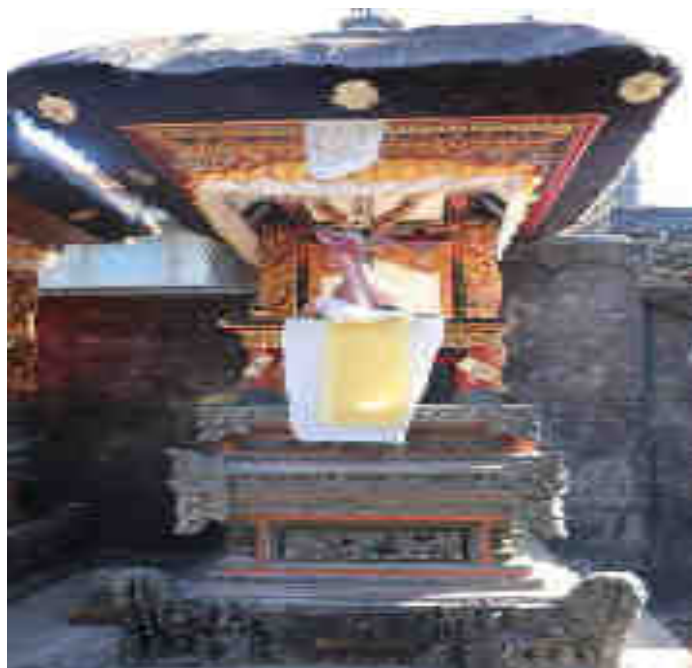
Saluang Maspait Palinggih Ida Bhatara Mpu Kuturan