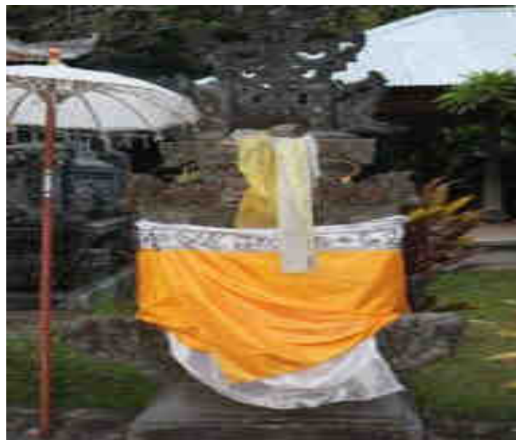
Palinggih Ratu Gedé Segara