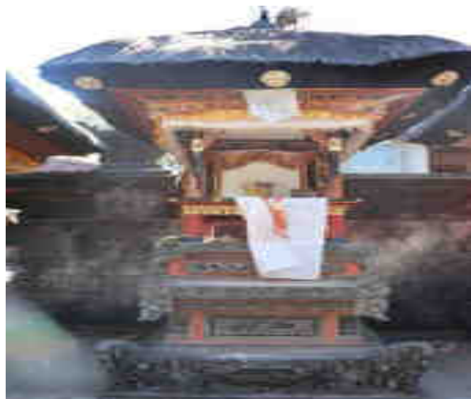
Palinggih Ratu Gedé Panyarikan