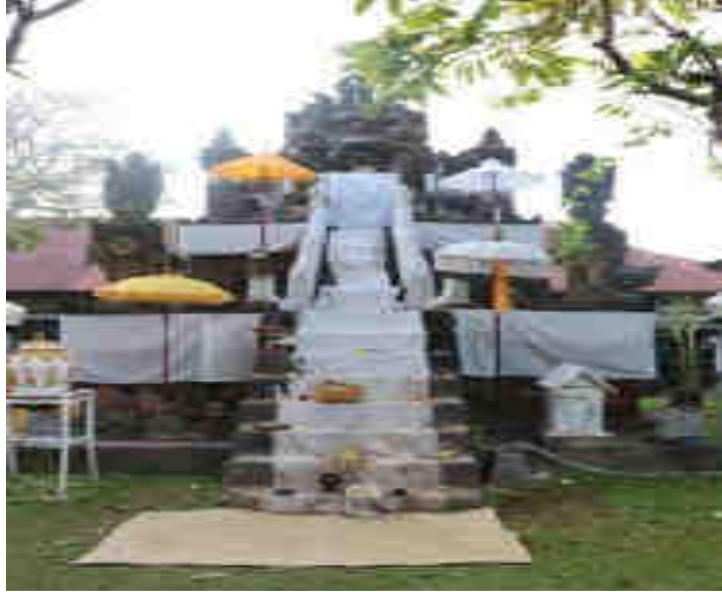
ບູຮູ ບໍລິເວນກາງບາບາສີຍາມສູງຢາກວມກຸສົນ