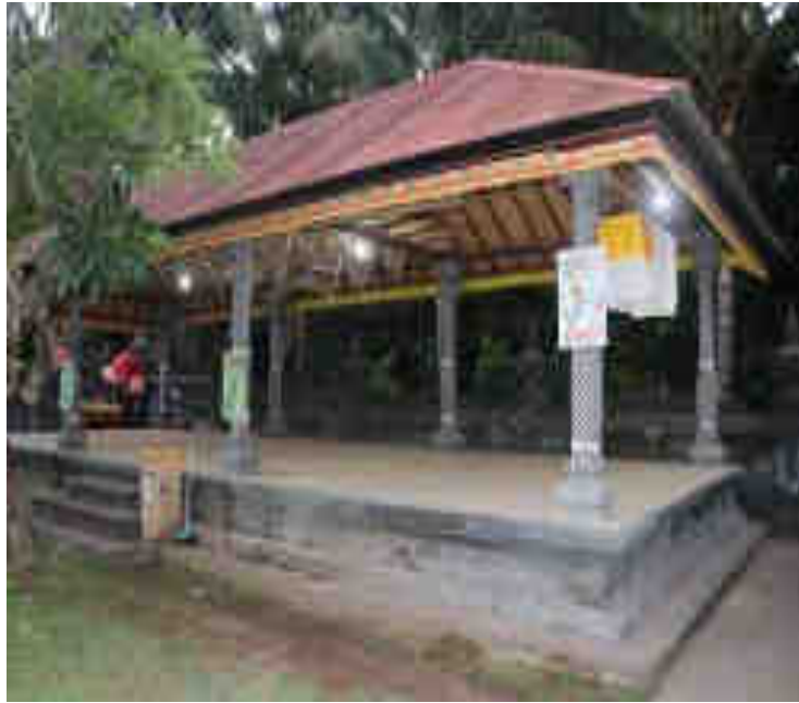
ព្រះបារមី