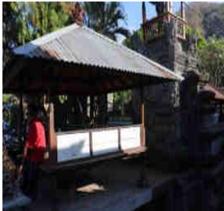
កាតាបសាស្ត្រ។