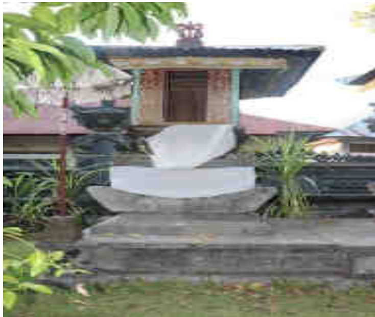
ບ້ານ ບໍລິເວນກາງບ້ານຍາມສູງຢາກວມກຸສົນ