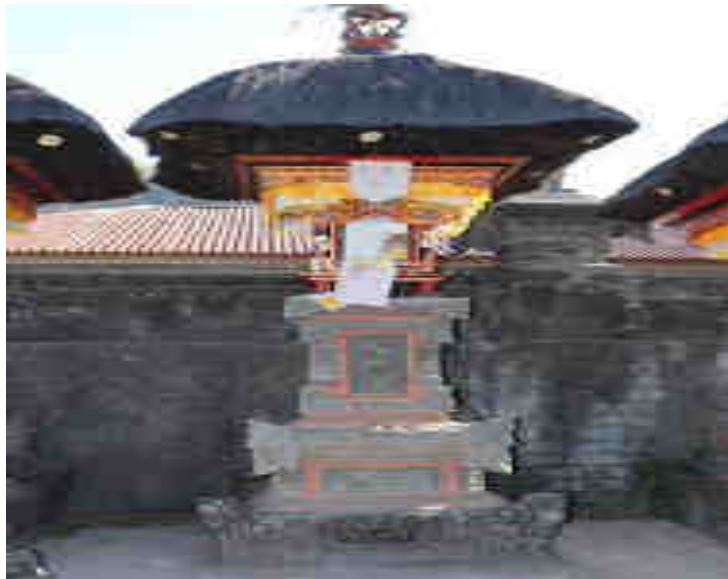
Palinggih Gunung Sari Palinggih Ida Bhatara ring Gunung Batur