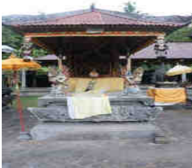
ຍຕູວາຕາຊາໂປ່ງ ບາບິເຊີງຕູວາຕາຊາກາຍາຊາງຊາງກາລີ