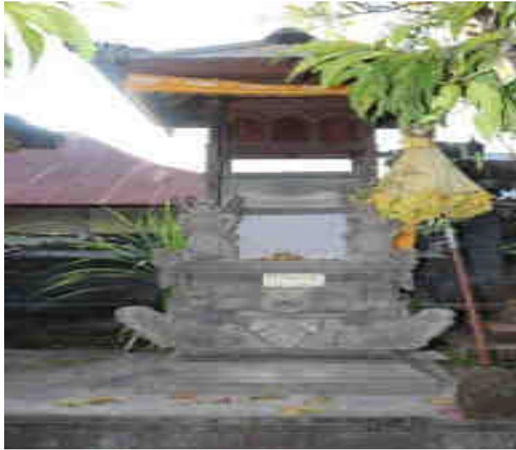
ຖ້ຳເທີເກ ບໍລິເວນຖ້ຳເທີເກສະໜອງບາດຳ