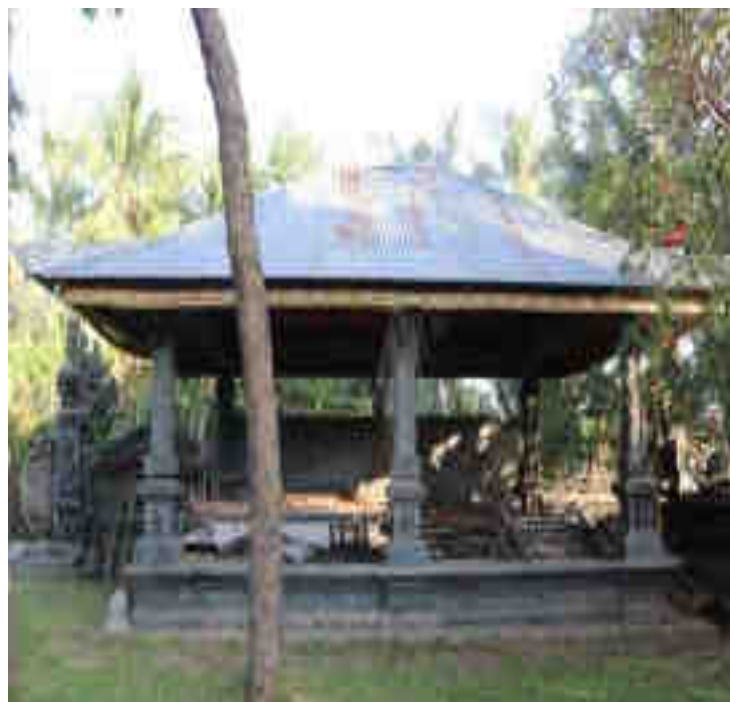
Balé Gong Alit