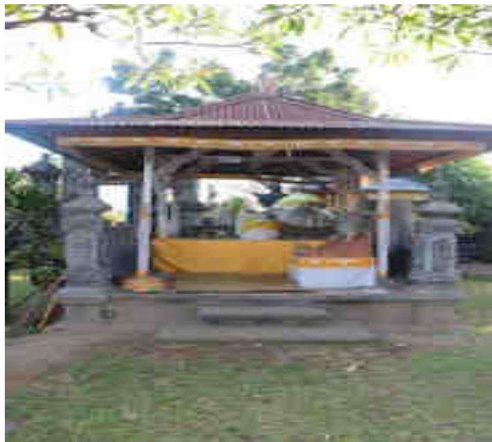
Paruman Singarata Palinggih Paruman Ida Ratu Mas Dalem