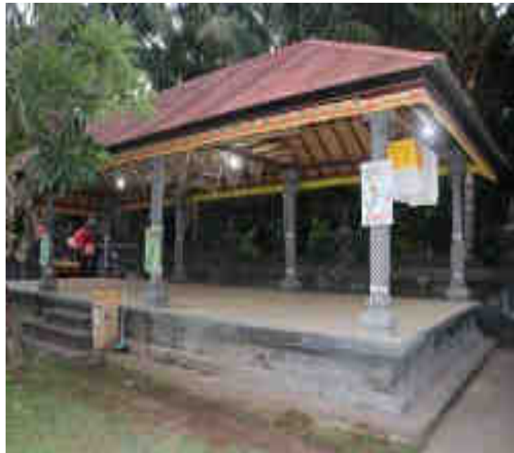
Balé Gong Ageng