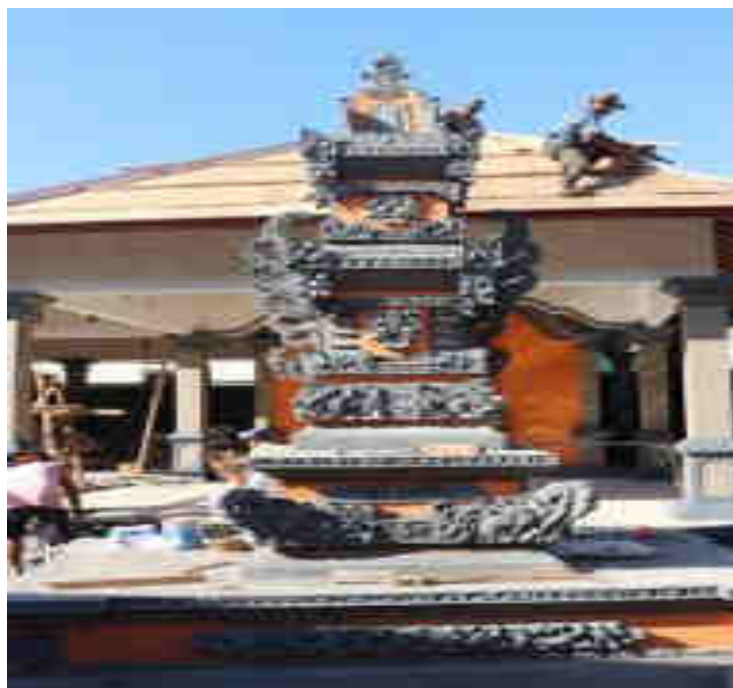
Palinggih Ratu Gedé Segara