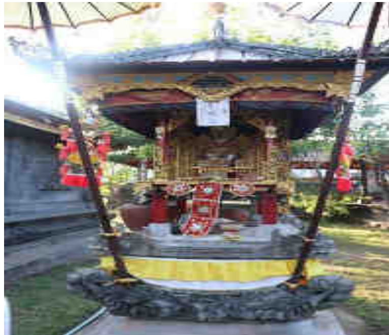
Piasan Plangkiran Palinggih Karihinan Ratu Tangkas