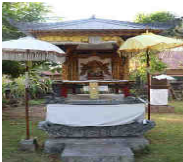
Palinggih Karihinan Ratu Ketut Songkét