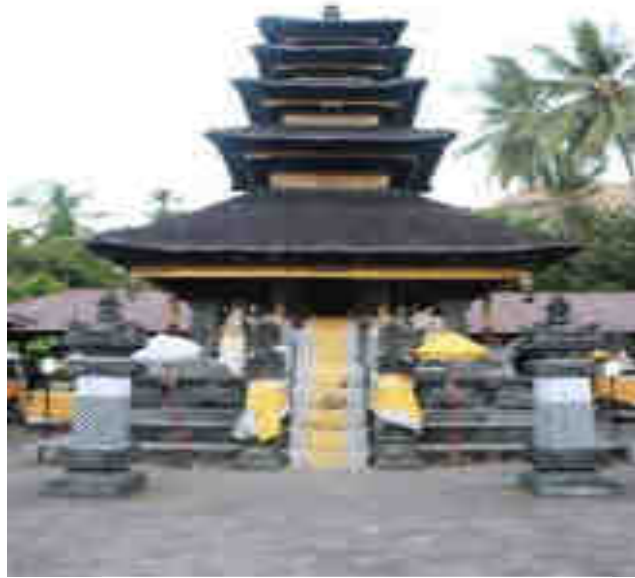
Méru Palinggih Ratu Gedé Mutering Jagat