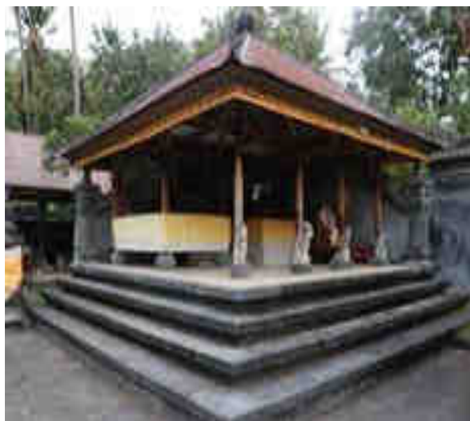
Paruman Palinggih Ida Bhatara Kabéh