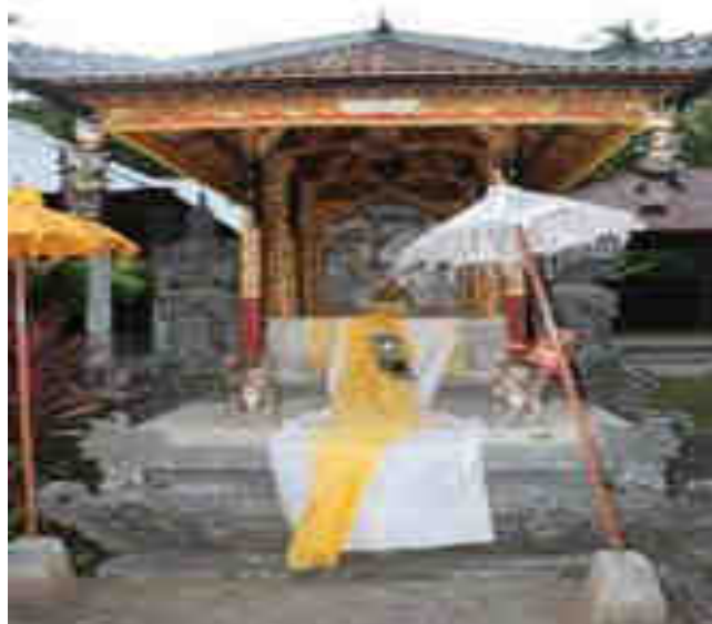
Karihinan Sangging Palinggih Ida Bhatara Kawitan Sangging