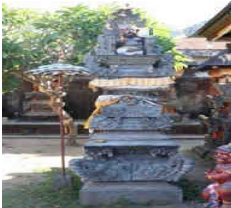
Palinggih Ratu Ketut Petung