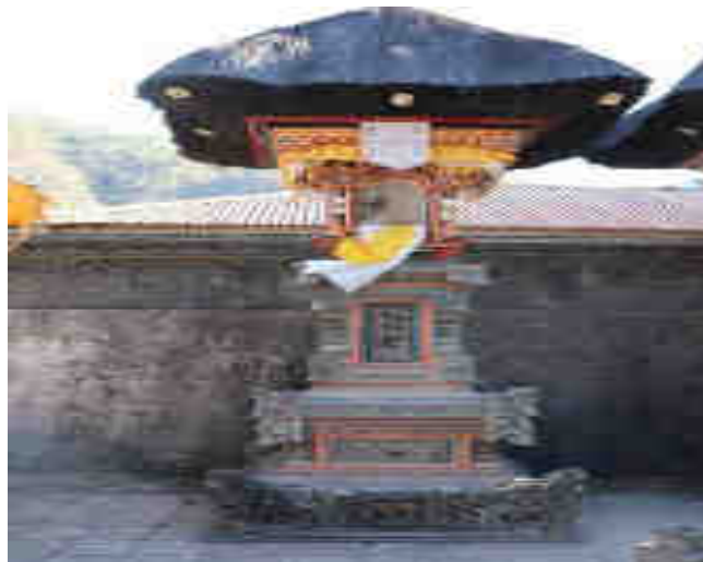
Palinggih Gunung Agung Palinggih Ida Bhatara ring Gunung Agung