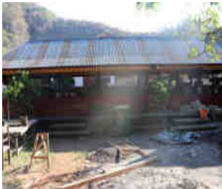
Balé Paruman Mamas