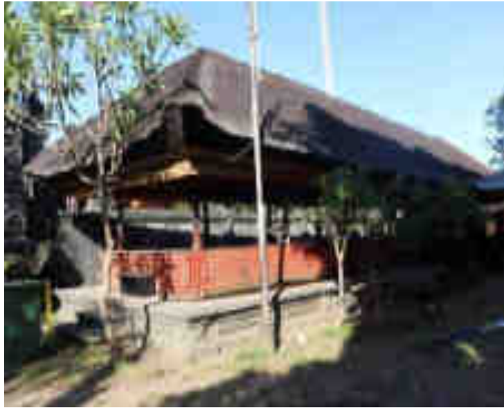
ព្រះបរមរាជវាំង