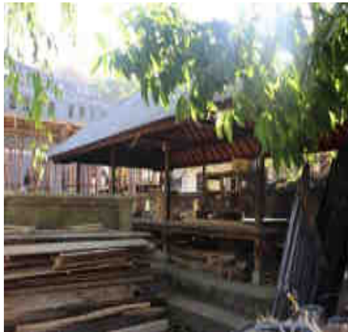
Parantenan miwah Balé Pébatan