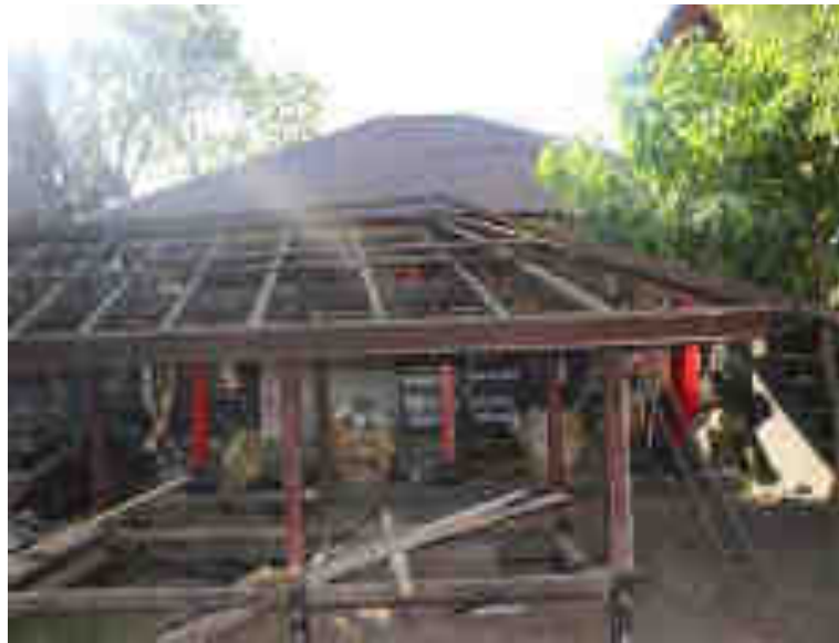
Balé Gong Alit