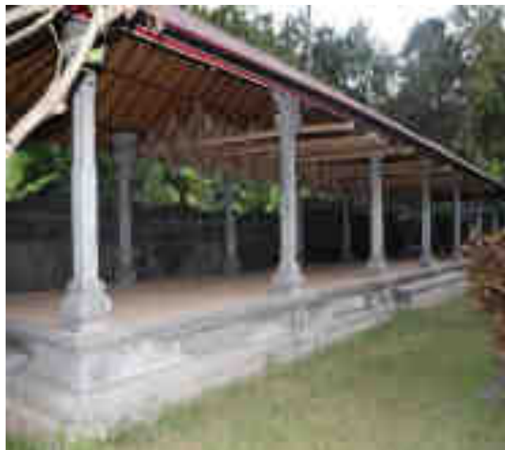
ព្រះបរមរាជវាំង