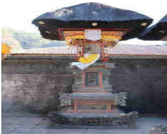
တုရှ်ဟေရီ၊ ပင်ပိုင်ဗုဒ္ဓဆရာတစ်ဆူကတုရှ်ဟေရီ။