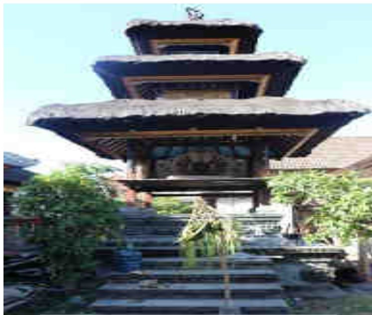
ហរិក្កិវរាហ្យតិវាហត្តតាតិ។