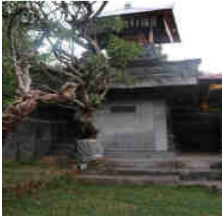
ព្រះបរមរាជវាំង