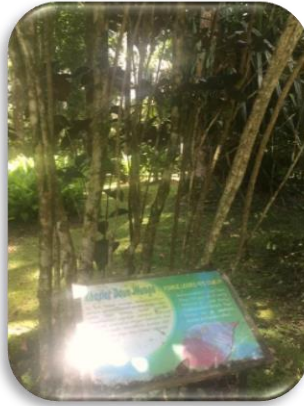
Gambar 3. Pohon Daun Wungu dan Khasiatnya