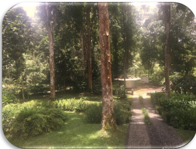
Tata Letak Taman Usada Kebun Raya Bali

Berdasarkan gambar 2, dapat dilihat desain taman berbentuk lingkaran dengan lekukan terasering dan jalan