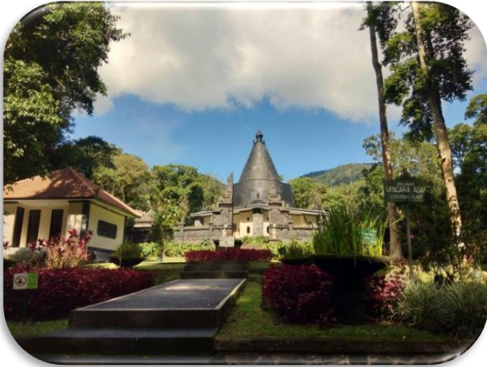
Gambar 1 Taman Upacara adat