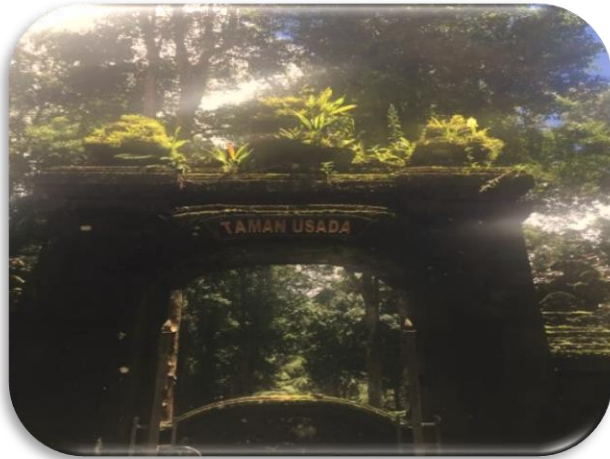
Gambar.1 Pintu masuk Taman Usada

Berdasarkan gambar 1, dapat dilihat bahwa Kebun Raya Bali memiliki Taman Usada seluas 1,6 Ha yang merupakan areal koleksi tumbuhan obat tradisional Bali yang dibangun dengan konsep konservatif dan estetika.