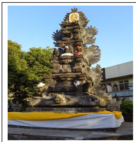
Gambar 2. Padmasana tampak depan