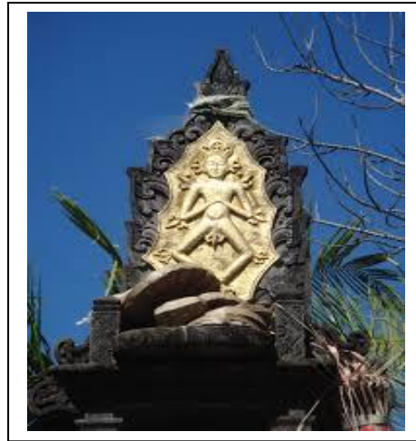
Gambar 1. Acintya di dibagian atas depan Padmasana

Acintya diletakkan di bagian atas depan, adalah simbol Hyang Widhi yang tidak dapat dilihat, dipikirkan wujudnya, di raba, namun vibrasinya dapat dirasakan. Posisi atau sikap Acintya dalam media penggambaran sangat bervariasi. Secara kasat mata, Acintya merupakan gambaran dari sosok beranatomi manusia tanpa jenis kelamin (tidak laki-laki, tidak perempuan, juga tidak banci ( netrum ), berdiri dengan dua kaki ( dwi pada ) atau pula dengan satu kaki (kaki kiri di bawah, kaki kanan terangkat). Lalu sikap tangan, ada yang Amustikarana , Dewa Pratistha , Anjali Mudra dan ada juga satu tangan di dada, sedang satunya lagi menjulur ke bawah. Variasi lainnya nampak pada hiasan yang menyertai sosok Acintya itu seperti lukisan cakra dan padma dan terdapat aksara suci “Ang, Ung, Mang dan Ong”.