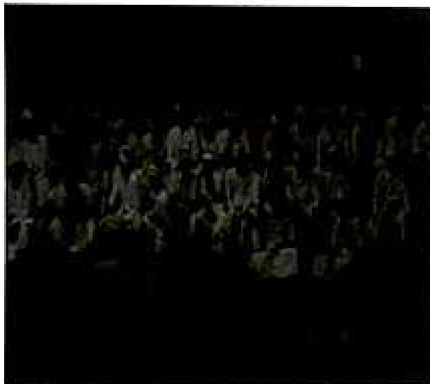
Gambar 2. Sekaa Teruna

Setelah semua sarana upacara pidalan dipandang lengkap dan diletakkan sesuai dengan tempatnya dan ulu apad duduk di Bale Agung, tiba saatnya Bhatara Dalem Pingit katurang pidalan . Prosesi upacaranya diawali pider sekar , yaitu upacara membagi-bagi bunga angit dan lekesan (daun sirih yang dilengkapi dengan kapur sirih dan pinang) untuk disuntingkan di telinga kiri, sedangkan bunga angit disuntingkan pada telinga kanan. Penggunaan bunga angit bermakna sebagai kesucian lahir batin, sedangkan lekesan yang digulung menandakan sebuah kesepakatan, perjanjian dalam dirinya untuk suatu kebulatan yang tunggal. Setelah pider sekar , tari Babuang siap untuk dipentaskan. Sebelum dipentaskan, semua anggota sekaa teruna berkumpul di bale wantilan untuk mendengarkan petuah-petuah dari Jro bendesa adat. Isi nasihatnya, mereka yang ikut mementaskan tari Babuang tidak boleh memiliki rasa permusuhan walaupun dilaksanakan ala perang karena tarian ini adalah tari wali yang disakralkan. Sekaa teruna sedang berkumpul mendengarkan pengarahun dari Jro Bendesa Adat dapat dilihat dalam gambar berikut.