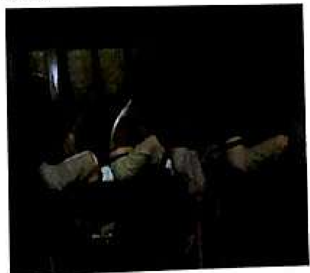
Gambar 1. Ulu Apad di Bale Agung

Selesai rayunan dipersembahkan, dilaksanakan pengamuon , yaitu semua ulu apad Desa Pakraman Pengotan menuju Bale Agung untuk mengambil tempat sesuai dengan kedudukannya masing-masing. Kegiatan ini dikoordinir langsung oleh jero nyarik . Para ulu apad saing duang dasa sedang duduk di Bale Agung dapat dilihat dalam gambar berikut.