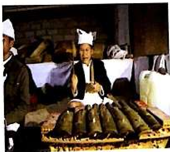
Gambar 6. Penabuh Gamelan Gambang

Gamelan ini terbuat dari bilah bambu dengan tangga nada lebih rendah dari gamelan gong yang biasanya dipukul pada waktu upacara keagamaan (Tim, 2008 : 244). Akan tetapi, gamelan gambang di Desa Pengotan-Bangli sudah menggunakan kerawang. Tetabuhan gamelan ini dalam ritual piodalan Bhatara Dalem Pingit ikut menambah semakin khidmatnya suasana ritual tersebut. Dengan berakhirnya pementasan tari Babuang , semua rangkaian ritual piodalan di Bethara Dalem Pingit dianggap selesai. Sekaa penabuh gamelan gambang sedang beraksi sebagai berikut.