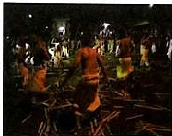
Gambar 5. Tari Babuang diiringi dengan gamelan Selonding dan Gambang .

Ucapan-ucapan Jero Mucuk disambut dengan meriah oleh sekaa teruna dengan ucapan masuryak sambil menarikan kedua tangannya. Sebaliknya, Jero Mucuk menyusulnya dengan ucapan mekade . Rangkaian selanjutnya adalah masing-masing penari Babuang membubarkan diri untuk bersiap-siap melaksanakan perang tanding. Menurut Jro Pasek , perang ini digelar pukul 00.00, dan tidak memiliki aturan yang baku. Para penari dalam perang tersebut tampak beringas dan bebas menggebuki atau memukul lawannya. Dalam perang tersebut tidak sedikit peserta yang terluka. Walaupun demikian, tidak ada rasa sakit di tubuh korban yang terluka serta tidak ada rasa dendam di antara mereka. Jika ada penari yang terluka, hanya cukup dioleskan minyak dan percikan tirta. Luka-luka dan kulit yang bengkak dari peserta perang papah biu dapat sembuh dalam waktu satu hingga dua hari. Dengan berakhirnya perang papah biu , semua rangkaian upacara Bhatara Dalem Pingit dan pementasan tari Babuang dianggap selesai. Penari Babuang sedang beraksi saling mengadu kekuatan dalam perang " papah biu " dapat dilihat dalam gambar berikut.