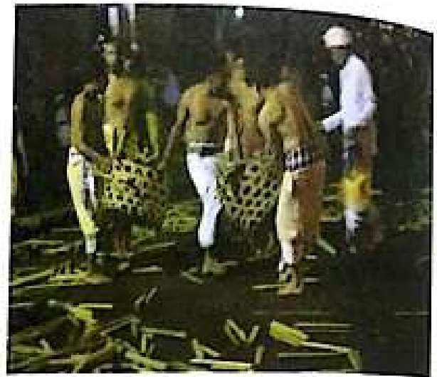
Gambar 3. Senjata dari Potongan Papah Biu

Selanjutnya beberapa orang di antara sekaa teruna ditugaskan meletakkan pelepah pisang yang telah dipong-potong di halaman madyaning mandala Pura Bale Agung. Potongan pelepah pisang yang berukuran kurang lebih 35-40 cm akan digunakan sebagai senjata oleh penari Babuang oleh penari Babuang dalam perang sehingga perang ini lazim disebut perang " papah biu ". Sekaa teruna sedang meletakkan senjata dari pelepah pisang dapat dilihat dalam gambar berikut.